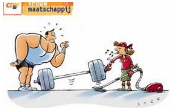
Vrouwendag 2014: "Respect voor de schoonmaaksters"

Naar aanleiding van de Internationale Vrouwendag (8maart), roept Vrouw & Maatschappij West-Vlaanderen op tot meer respect voor schoonmaakpersoneel (m/v). Samen met de regionale V&M-afdelingen trok ik naar Brugge (AZ Sint-Lucas) en Kortrijk (Zorggroep Heilig Hart) om de daad bij het woord te voegen. Alles over de (ludieke) actie lees je hier